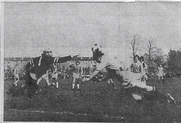
De S.V.F.-keeper en SEC-speler Timmer duiken beiden naar de bal, maar deze wordt door geen van tweeën bemachtigd.

Over het geheel gezien heeft S.V.F. deze beslissingswedstrijd en de promotie verdiend gewonnen, daar zij veel koelbloediger en laborseer speelde dan SEC. Zij zullen het komende seizoen in de 3e klasse KNVB kunnen starten. SEC heeft deze competitie zijn amshangers zeker alles geboden aan spanning, die er kon zijn.