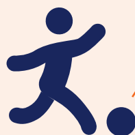
Huidig Schieten of passen