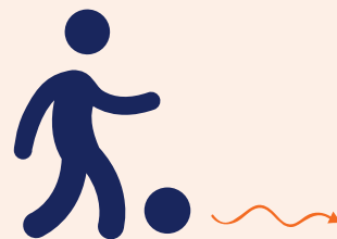
Nieuw Dribbelen, schieten of passen